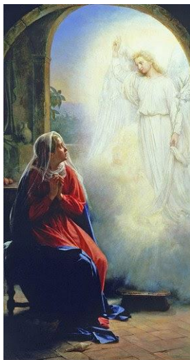
The Annunciation by Carl Bloch

Bij het kerstverhaal vanaf de aankondiging aan Maria, Maria's reis naar haar nicht Elisabeth, Jozefs dilemma: Maria verlaten of bij haar blijven t/m de reis naar Bethlehem, zijn door de eeuwen heen, o.a. in middeleeuwse gebedenboeken, de mooiste illustraties gemaakt.